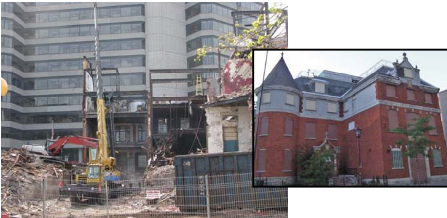
Figure 4 : cité en 2003

Bien qu'il soit le seul bâtiment cité depuis la fusion municipale en 2002, le bâtiment est laissé à lui-même et se dégrade sans que la municipalité n'intervienne. En 2009, la Ville de Gatineau intervient quelques heures trop tard pour empêcher la démolition de ce bien protégé. Le fautif sera mis à l'amende (130,000$), le propriétaire fera faillite et l'entrepreneur conteste en cour l'amende imposée. Aujourd'hui, un simulacre de Chez Henri a été reconstruit sur le site : plus rien à voir avec le patrimoine qui avait été protégé!