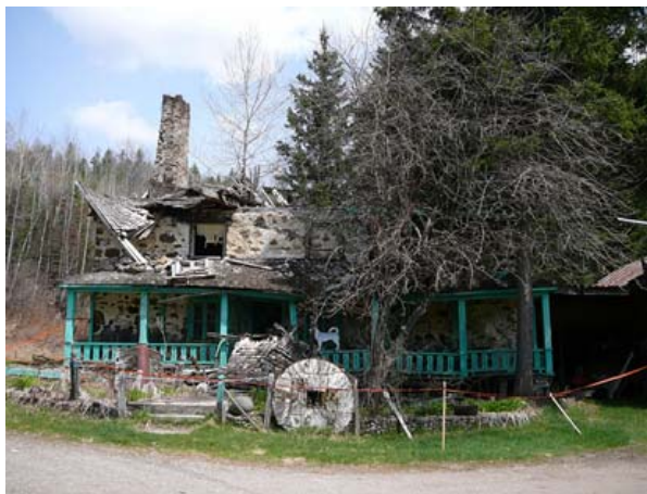
Figure 2 : ...on a laissé le moulin déperir, jusqu'à ce que la structure du toit s'effondre en 2008. On procédera à son démantèlement sous supervision du MCCC.