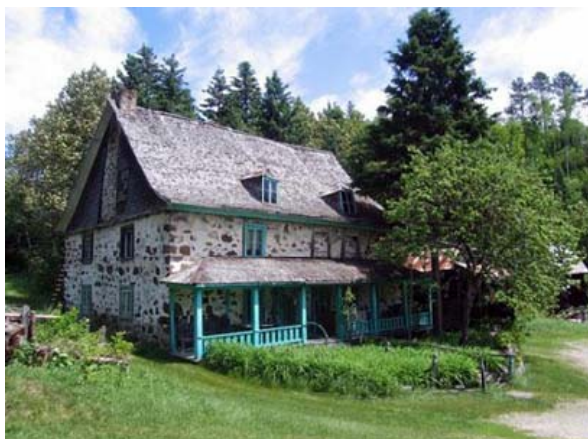
Figure 1 : classé en 1965. Malgré la LBC, avec ses articles contraignants et le maintien d'un carnet de santé...