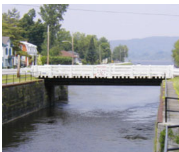
Figure 5 Le canal de Grenville est un ouvrage de génie militaire britannique ayant été construit à la suite de la guerre anglo-américaine de 1812. Il a été cédé par le fédéral au gouvernement provincial en 1988, qui l'a cédé en 1990 à la municipalité de Grenville. Malgré ses bonnes intentions, la petite municipalité (moins de 1500 habitants) ne peut assumer à elle seule le fardeau financier qu'impliquent les travaux aujourd'hui nécessaires de stabilisation.

Notre réflexion : Les municipalités n'ont pas toujours les moyens que commande la valeur du patrimoine qui se trouve dans leur localité. Ils ont besoin de l'aide de l'État pour rencontrer leur responsabilité à l'entretenir pour les générations futures. Ce patrimoine dépasse la signification locale, bien que ce soit la municipalité qui en soit responsable. Une délégation de responsabilités aux instances locales ne doit pas signifier désengagement de l'État.