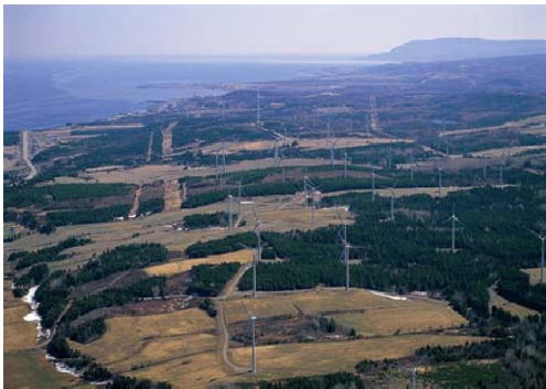
Figure 7 Actuellement, la seule contrainte pour l'établissement d'un parc éolien est son acceptabilité sociale. La LBC n'a aucun volet pour protéger le paysage culturel. Dans la nouvelle loi, la possibilité pour un milieu de désigner un paysage culturel patrimonial n'apportera vraisemblablement pas à court terme de solutions pratiques pour la localisation de parc éolien. La pression sur les milieux demeure.